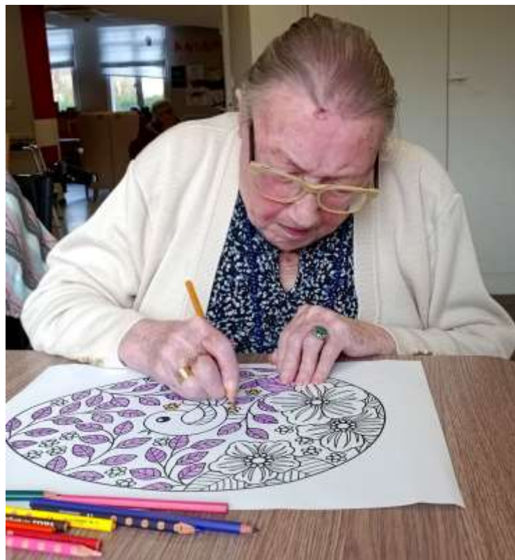
Mandala de Pâques