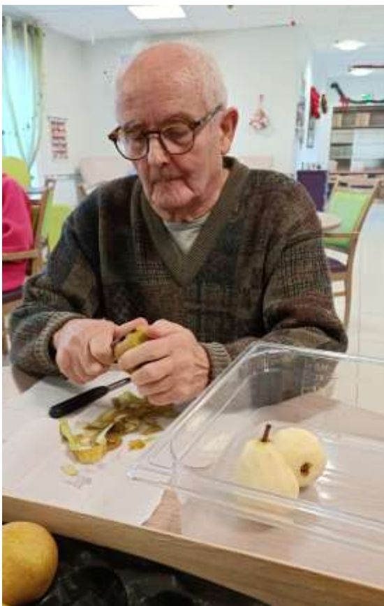
Atelier épluchage à l'USA